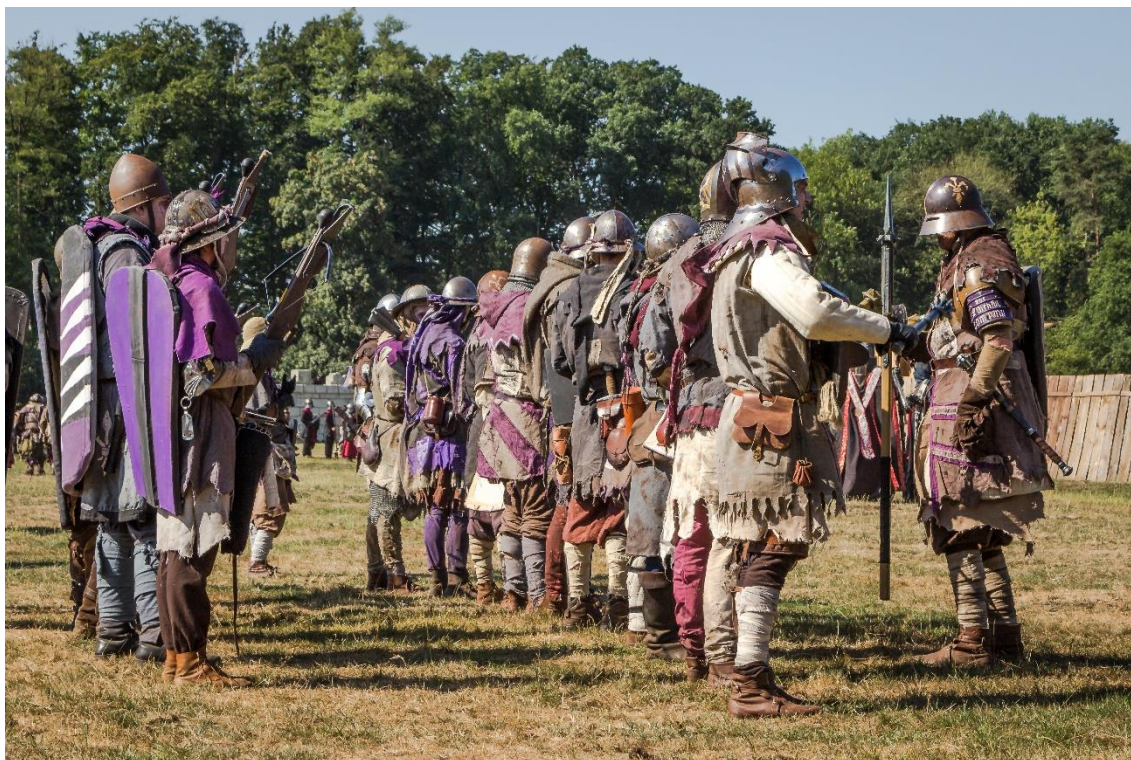
Figura 3 – Conquest of Mythodea .