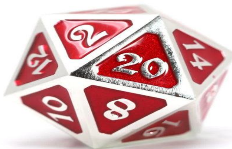
Figura 2 – Dado D20